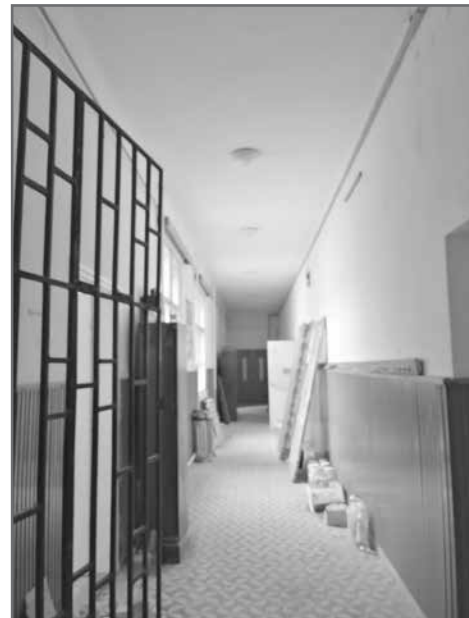
A felújítás előtt

Telephelyünk eddig a SESZI Gondozóházában volt, azonban a COVID-19 vírus első hullámában kialakult helyzet miatt, az otthonban lakó idősök egészségi állapota érdekében el kellett hagynunk az addigi intézményünket. Ideiglenesen elhelyezésre kerültünk, és a fenntartó (önkormányzat) részéről lehetőséget kaptunk egy új munkahelyi környezet kialakítására, a régi Mészöly Géza Általános Iskola egyik szárnyában.